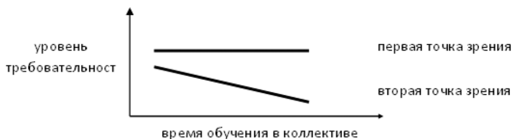
Рис. 2 — уровень требовательности руководителя в зависимости от времени обучения воспитанника

Практика показывает, что наиболее сложно решается данная проблема применительно к отношениям руководителя с воспитанниками различных периодов обучения (рис. 2). Одни руководители считают, что требовательность должна быть постоянно высокой.