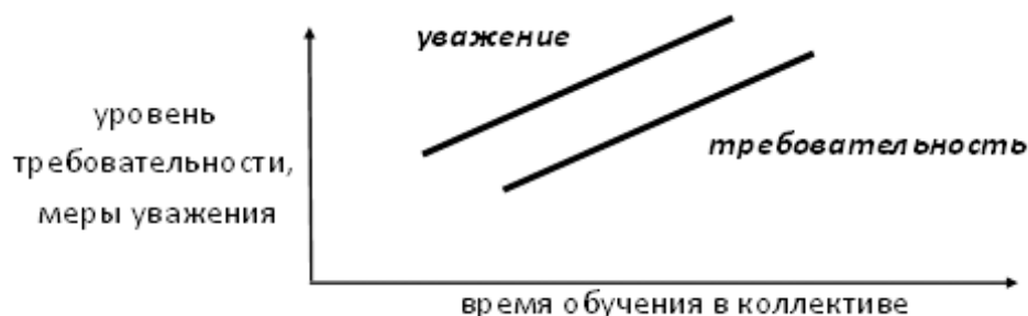
Рис. 3 — динамика уважения и требовательности по «золотому правилу» А. С. Макаренко

Обе эти линии характеризуют подъем, повышение как требовательности, так и уважения. Для дела укрепления дисциплины принципиально важно, чтобы с первых дней обучения новичка в коллективе величина требований была умеренной. Но не менее важно, чтобы уровень предъявляемых требований постоянно повышался.